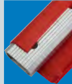
Sprossenbeläge lassen sich einfach ersetzen