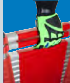
Sicherungssystem verhindert Quetschungen