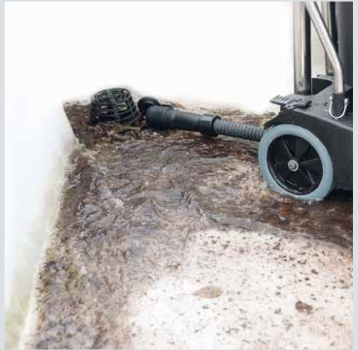
Ablass-Schlauch zur restlosen Entleerung des Behälters