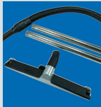
inklusive umfangreichem Zubehör