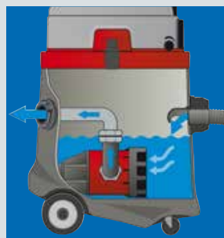
Ansaugen und Abpumpen in einem Arbeitsgang